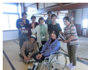
柏戸記念館で 土俵をバックに

汗ばむ位の暖かい天気にも恵まれ、毎日の 仕事から離れ美味しい芋煮が食べられて りんごも美味しかったよ。 来年も楽しみにしていま〜す。