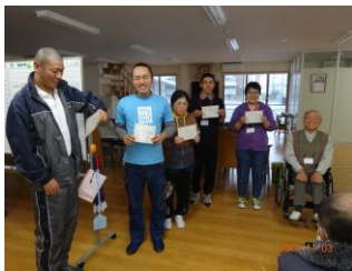
賞状を持って喜びの笑顔!!!

オフィス「ひので」では毎月休まず通ってくれた人を少しでも励みとなればという目的で皆勤賞として表彰しています。毎日元気な顔を見るのが楽しみです。