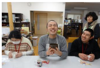
たてた抹茶をいただいで おいしい笑顔

3月3日ひな祭りを行いました。2月下旬から7段飾りのお雛様を飾り3日当日はひな祭りの歌、ボランティアさんから抹茶を点でて頂き、優雅にお茶と白酒を飲み雛菓子を食べて過ごしました。抹茶の味はどうだったかな??