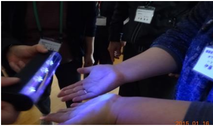
ブラックライトで 手洗い後のチェック

では、日出西町内会長様にも参加頂き、手の洗い方、洗った後の汚れの残り具合等、その重要性を花王石鹸社員の方に講演と手洗いの実践をして頂いた。その結果全員が指の間に汚れが残っており、従来の手の洗い方では駄目な事を再認識した。汚れの残り易い所は、爪先、指と指の間等手の甲、手のひら両方とも残り易い場所でした。皆さんも気を付けて手を洗いましょう。