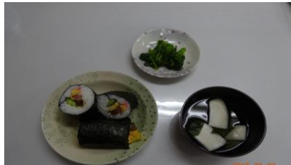
ひので自慢の恵方巻き!!!

2月3日は節分で盛大に豆まきを行いました。昼の食事は恵方巻きを食べ、その後職員扮する鬼を目がけ豆をまいて楽しいひと時を過ごしました。鬼になった職員は当てられた豆の痛みをこらえ名演技でした。節分は一つの節目で、2月4日は立春、待ち通しい春の訪れを皆で感じる日となりました。