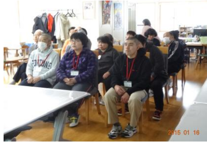
真剣な顔で講演を聞く受講者