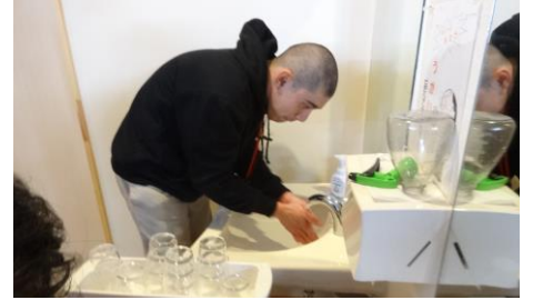
一生懸命手を洗っています