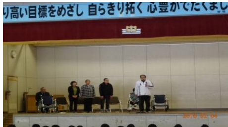
全校朝会で車椅子を頂き 利用者代表が御礼のご挨拶 をしています!!!

2月4日鶴岡市立第三中学校生徒会様よりペットボトル、アルミ缶の収集活動で得た資金で買った車椅子をいただきました。第三中学校皆様の地道な活動と善意に感謝致しますと共に大切に使用させていただきます。皆様の温かい心に利用者一同御礼申し上げます。