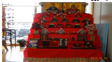
7段飾りの豪華な雛人形