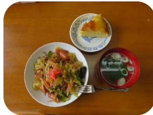
焼きそば スープ デザート