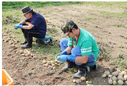
「ひので」農園 松尾 じゃがいもの収穫

鶴岡市内3か所 の「ひので」農園 で、今年も じゃがいも、 枝豆、さつ まいも等の 収穫作業を 行います。