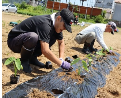
「ひので」農園 切添町 枝豆の苗植え