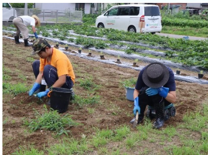
「ひので」農園 桜新町 さつまいも畑の除草