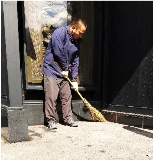
総穂寺様(陽光町) 境内のはき掃除