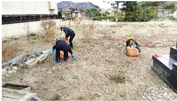
東昌寺様(陽光町) 草取り