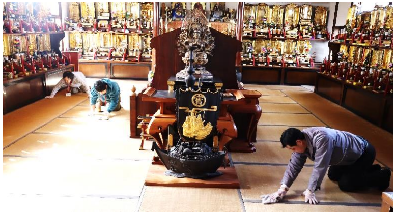
洞雲院様(文下) 本堂の掃除