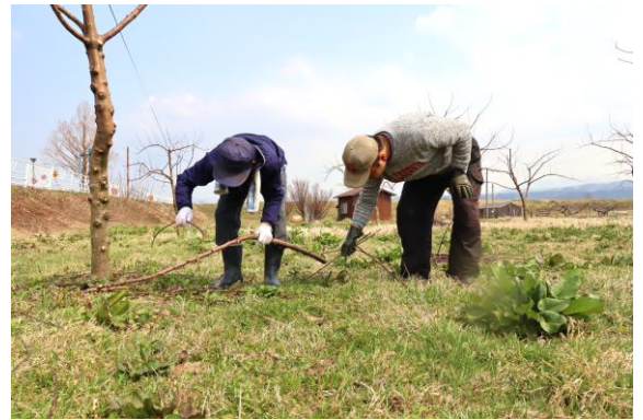
インフィニファーム様のりんご畑